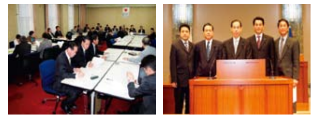
自民党議員総会研修会 20年度予算説明・検討会 五輪会の5人 毎月勉強会を行っています