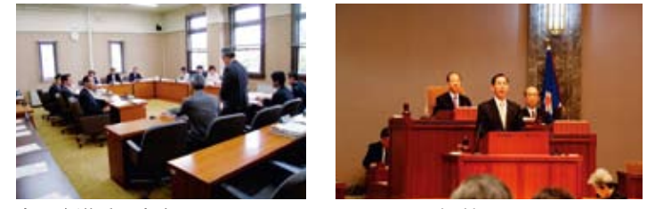
企画空港委員会中 12月10日一般質問