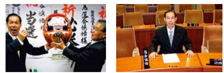
平成19年4月8日当選 議場で