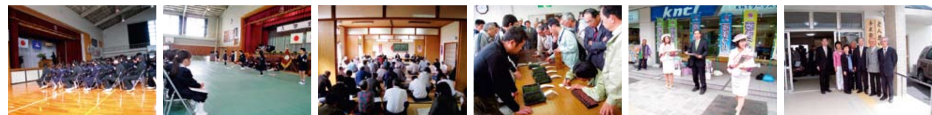
藤枝北高校卒業式 藤枝高洲南小学校入学式 築地町内会総会 藤枝市新茶初取引 東京有楽町で藤枝PR 藤娘とともに 高洲と左衛門町内会館 新築落成式県知事とともに