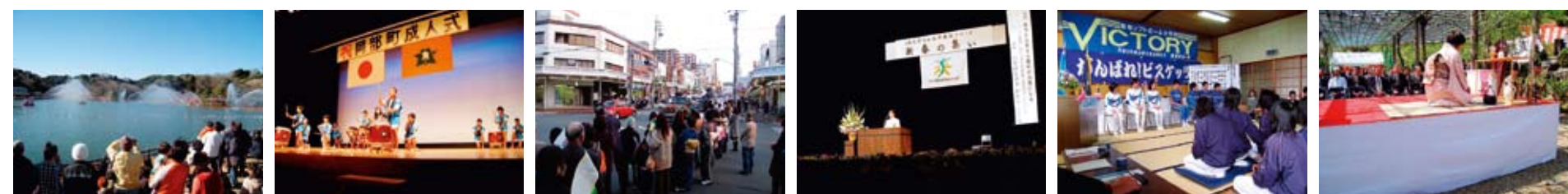
藤枝市消防団出初式 岡部町成人式 藤枝東高サッカー準優勝 藤枝駅前パレード JA大井川農協女性部 新春の集い 築地スポーツ少年団築地 ビスケッツ 卒団入団式 藤枝市蓮華寺池公園 献茶祭