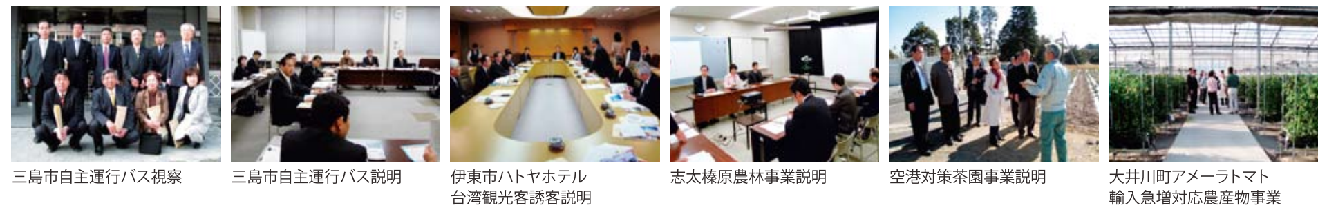
三島市自主運行バス視察 三島市自主運行バス説明 伊東市ハトヤホテル 台湾観光客誘客説明 志太榛原農林事務所視察 空港対策茶園事業説明 大井川町アメーラマト 輸入急増対応農産物事業