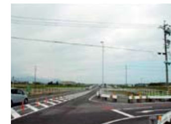
国150号志太~橋南バイパス 大井川町藤守付近