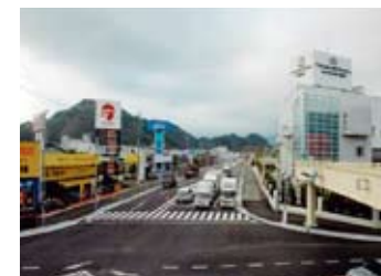
新東名藤枝岡部ICアクセス 焼津森線 飯宿付近