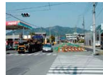
伊久美藤枝線 八木石油下之郷付近