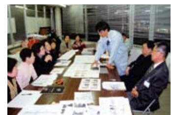
県職員による駅前道路工事説明 県道路保全室長、県土木課長他