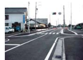
善左衛門藤枝停車場線 (志太西線)善左衛門付近