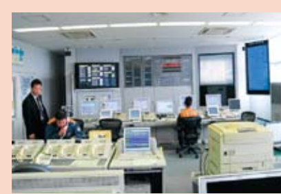
焼津市消防防災局通信指令室

島田市消防本部4人と焼津市消防防災局9人が通信指令に24時間従事している。9人の削減と管理費が大幅削減した。18年8月島田市から、指令台一元化依頼が藤枝市焼津市にあり、藤枝市は辞退したので島田市焼津市で一元化を進め4月1日に完了。現在、運用良好です。無線2波は了解済。藤枝消防司令室15人を統合した場合と比較検討してみたい。