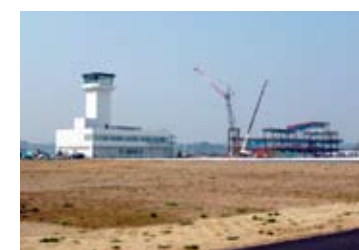
管制塔と空港ビル