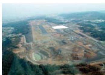
滑走路が急ピッチ