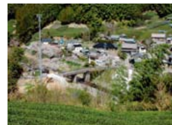
静岡朝比奈藤枝線 岡部町宮島石上橋改良