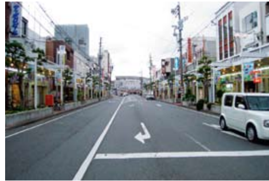
昼間はほとんど入通りが無い