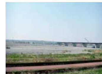
島田吉田線(県道並?工事) 大井川新橋(志太中央幹線)