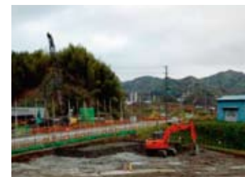
新東名藤枝岡部IC ロングランプ高田付近