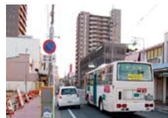
磐田駅前 駐禁解除事例 10時~12時と16時~18時