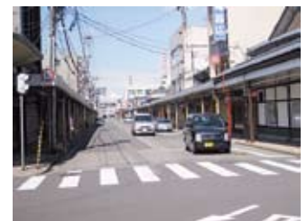
越前市大社通り商店街 駐車禁止規制の廃止