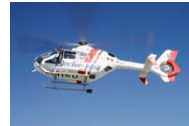
県西部ドクターヘリ