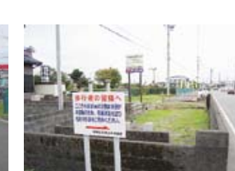
交差点から南側を見る。 歩行者を西に案内看板

この交差点道路には墓地が存在し、東側の歩道は使えません。歩行者・自転車通行は危険のため西側の歩道側を利用するように案内看板が立っています。 (5月、地元からの依頼で、私は県土木から事情説明を受け、調査を開始しました。) この墓地は平成14年から県と裁判で係争中です。 私は8月に大阪在住の地権者と話し合いました。10月に県との協議に応じ、月末に地権者と県庁で県当局と協議しました。地権者からの提案を県は検討中です。 先日、地権者から「ご通行中の皆様へ『お詫び』の文書」が届き、自治会長に渡しました。ここは通学路であり、大井川新橋が1年後に開通すると通行車両は倍増します。早期に解決できるよう一所懸命努力をしております。ご協力をお願いいたします。