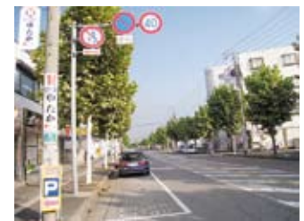
春日部市の駐車禁止 時間解除10時～17時