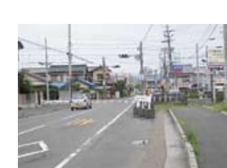
南側から交差点を見る。 歩道の先に墓がある