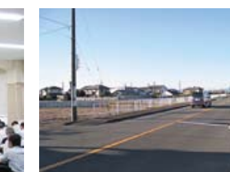
田沼街道志太中央幹線