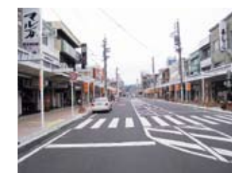
藤枝駅北口 れんが道商店街