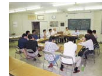
藤枝警察署交通課長 と委員の意見交換会

藤枝駅北口のれんが道商店街では北口の玄関として街づくりが進んでいます。しかし、商店街は人通りが少なく、駐車スペース不足で、来店客も減っています。今年3月に駅前商店街女性部と「磐田駅前商店街が10時～12時、16時～18時まで駐車禁止規制解除できた事例」の意見交換会をきっかけに、駅前振興組合の皆さんが「れんが道商店街」も真似してやろうと準備を進めてきました。 賑わいのある商店街にするため「れんが道商店街駐車規制緩和委員会」を作り、さらに、藤枝市、商工会議所、まちづくり会社、自治会等で組織する「れんが道商店街駐車規制緩和推進協議会」を立上げ、私が代表を務めることになりました。 全国の警察では駐車禁止を厳しく取り締まると共に駐車スペースが無い中心市街地商店街の来店客のために駐車禁止規制を緩和をしています。 9月に埼玉県春日部市と福井県越前市等を視察して来ました。(右写真) 藤枝駅前でも駐車規制緩和が可能な警察、市、商工会議所などと検討しています。 11月には静岡県警察交通規制課が駅前商店街の現地調査をしてくれました。 藤枝市を挙げての駐車規制緩和運動にしていかなければ許可は下りません。 署名活動を開始しました。ぜひ市民の皆様のご協力をよろしくお願いいたします。