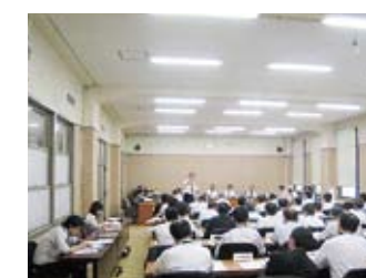
建設委員会 質問中