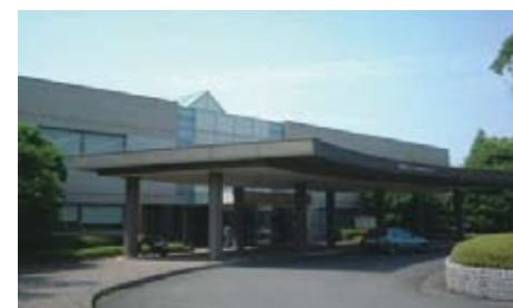
県立こころの医療センター