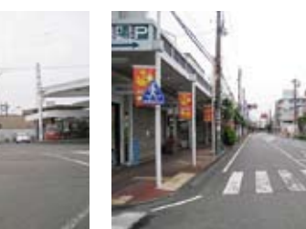
文化センター前付近 バリアフリー工事