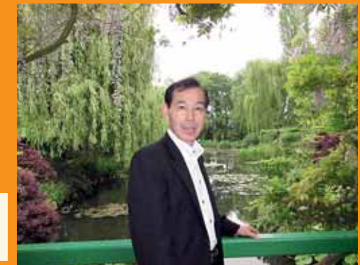
フランスにて「睡蓮」で有名な印象派モネが暮らした家と庭園を視察