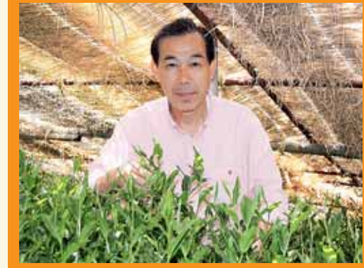
岡部町朝比奈地区の玉露茶園