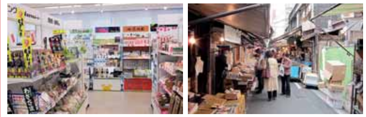
静岡県ブースに県内商品 東京築地市場 東京スカイツリー

銀座めざましではビル全体各階に全国各地の有名商品が展示販売されている。観光客が常時入場してくるので、PR次第では結構売れる。スカイツリーは近くでは高いのに高く感じない位大きい。