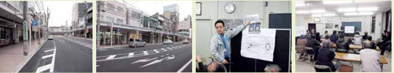
駅前方向に向って 向側から 市役所職員の説明 地元町内・商店街説明会