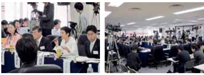
今回の事業仕分けは独立行政法人の無駄追求