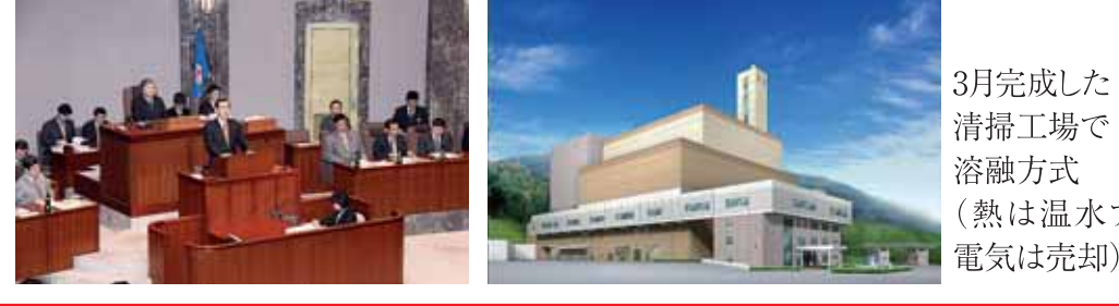
3月完成した清掃工場で溶融方式(熱は温水プール電気は売却)