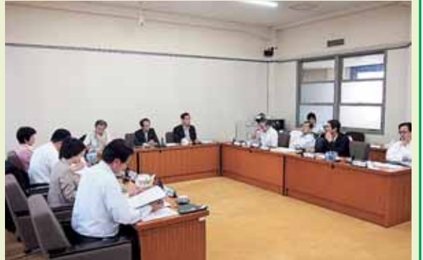
過疎・中山間地域振興特別委員会